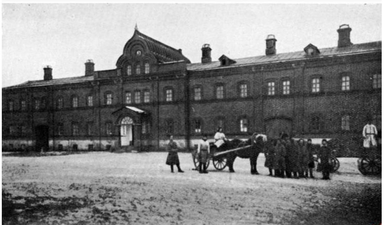
34. Конюшенный домъ на Валаамѣ.