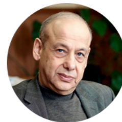
Александр Асмолов член Совета при Президенте РФ по развитию гражданского общества и правам человека