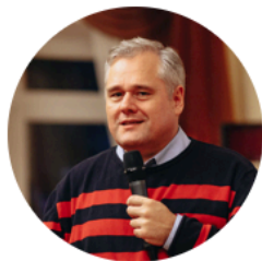
Игорь Реморенко ректор МГПУ