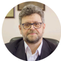
Аркадий Марголис ректор Московского государственного психолого- педагогического университета