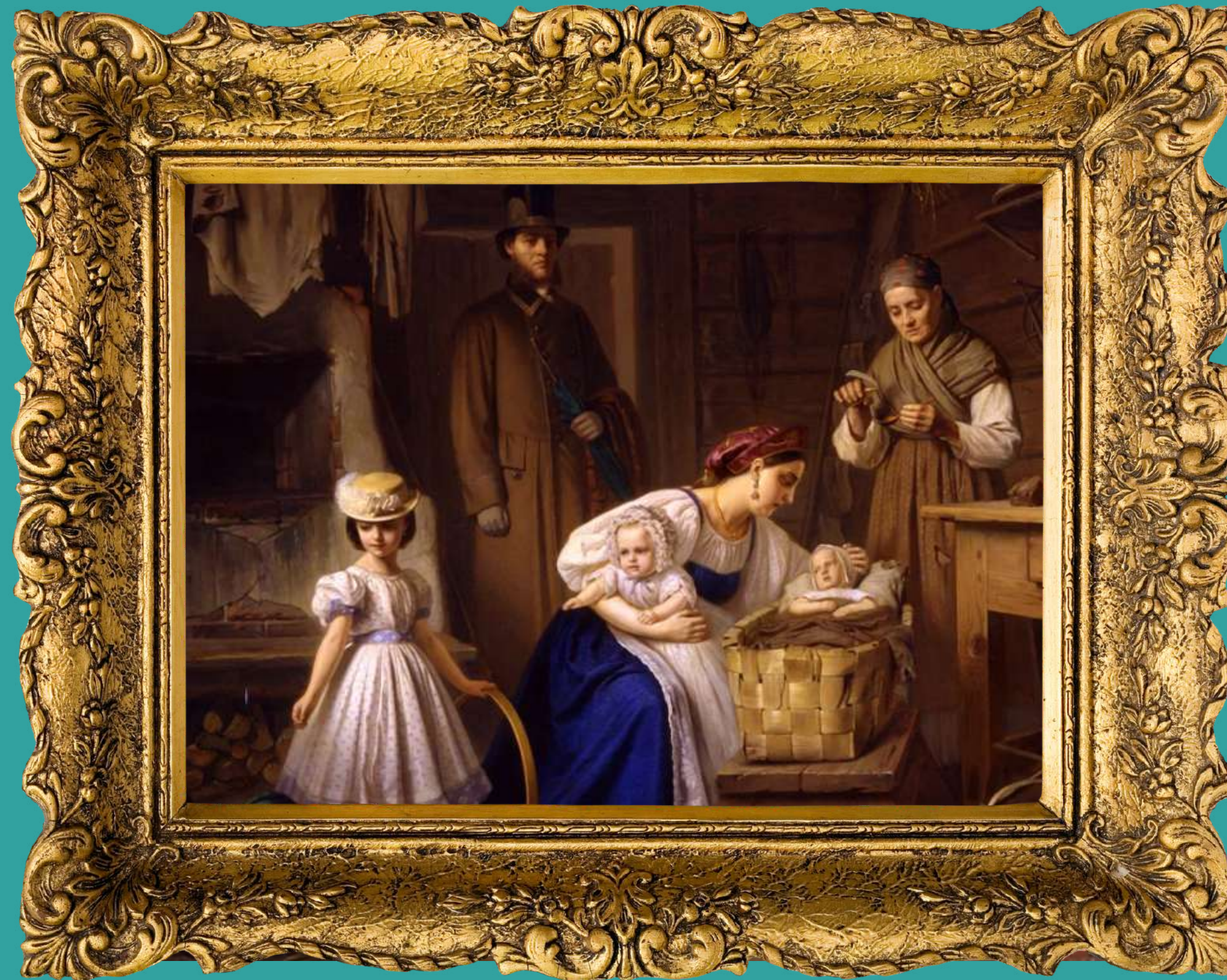
Карл Вениг «Кормилица пришла навестить своего больного ребенка», 1886 год